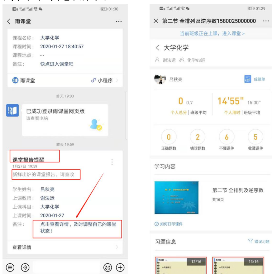
图 14 课堂报告

每次直播结束后每位同学都会收到雨课堂自动推送给大家的学习报告。错误习题、不懂课件、收藏课件、课程 PPT，雨课堂都帮各位同学整理好，关注每一节课的动态，助力你的改变和成长，如图 14 所示。