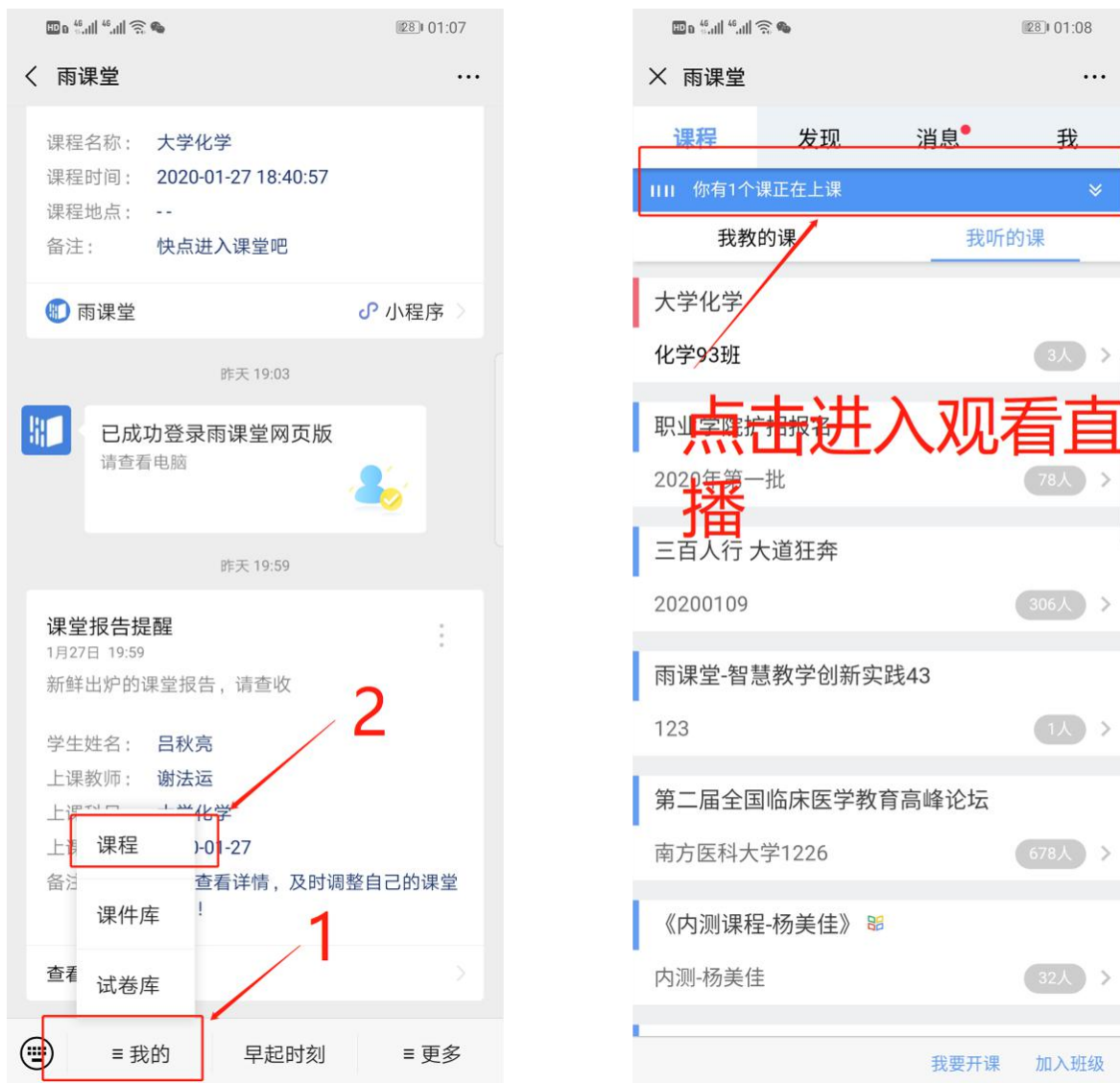
图6 公众号进入直播