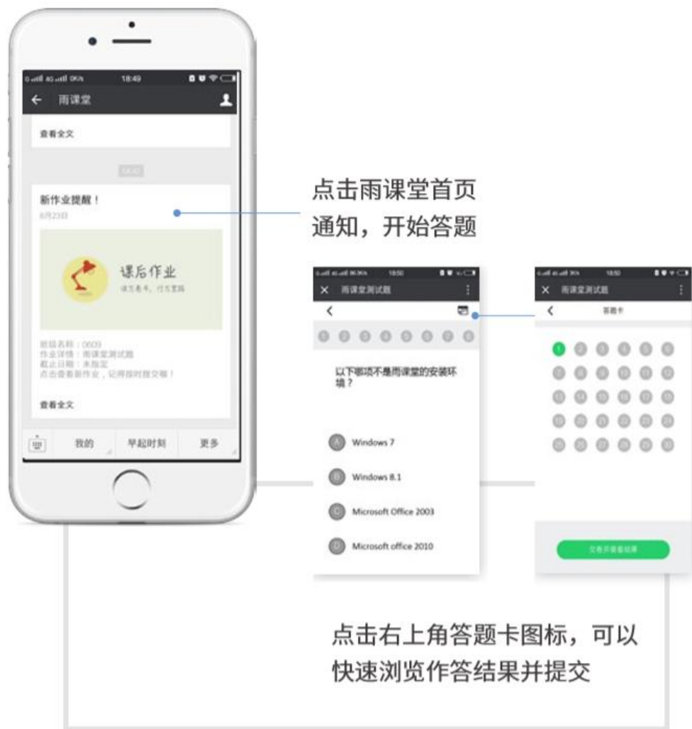
图 16 作业提醒