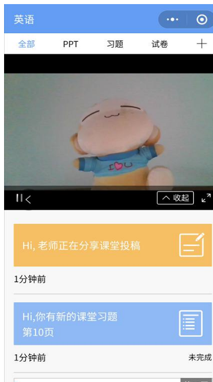
图 9 学生手机端直播预览效果