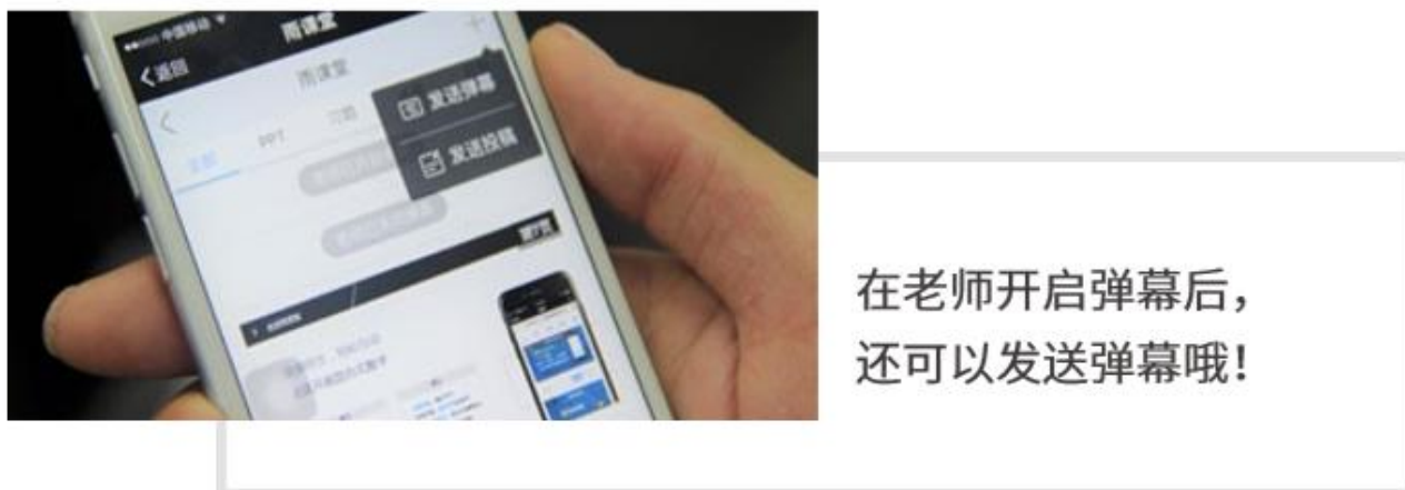
图 13 弹幕投稿操作