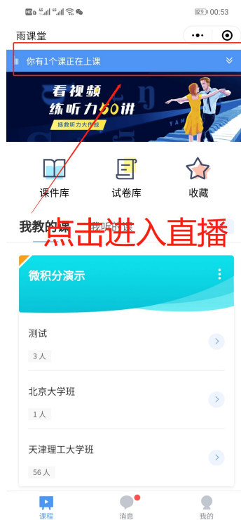
图5 小程序进入直播界面