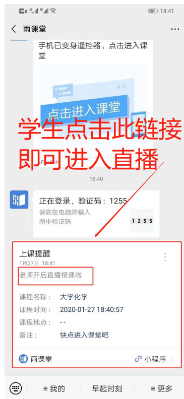
图3 学生接收上课直播提醒