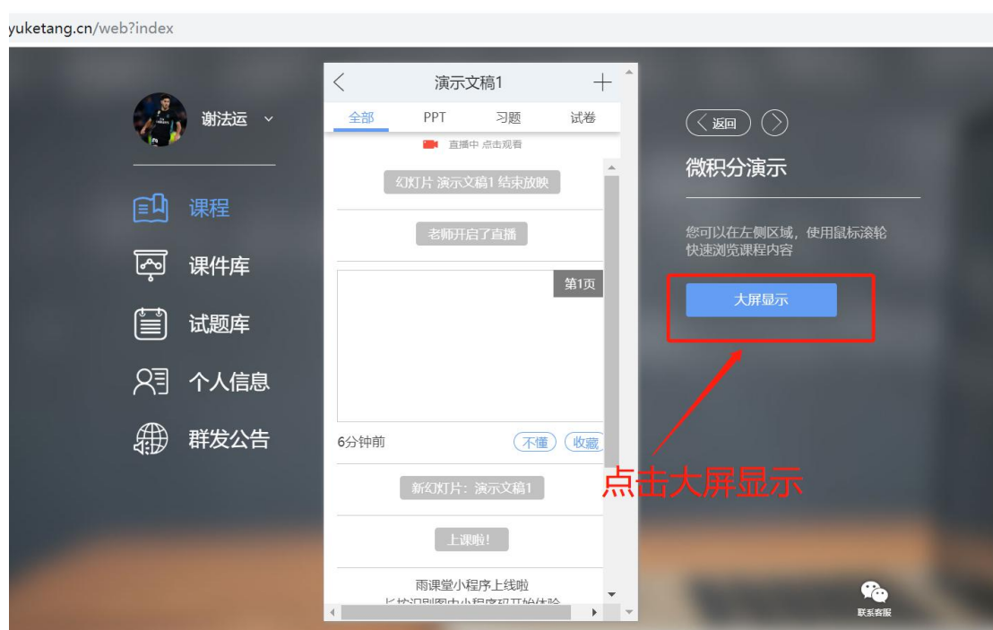
图 9 可进入大屏显示