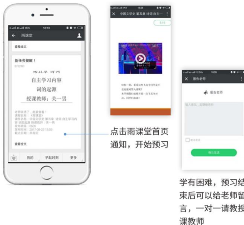
图 15 接收预习任务并完成预习

若老师给学生推送了预习资料，各位同学将在雨课堂公众号里收到相应的通知提醒，点击该提醒即可启动预习，预习之后带着思考去上课。（ 温馨提示：请在老师规定时间内完成预习。老师能看到你什么时候完成预习，预习了哪几页等信息 ）