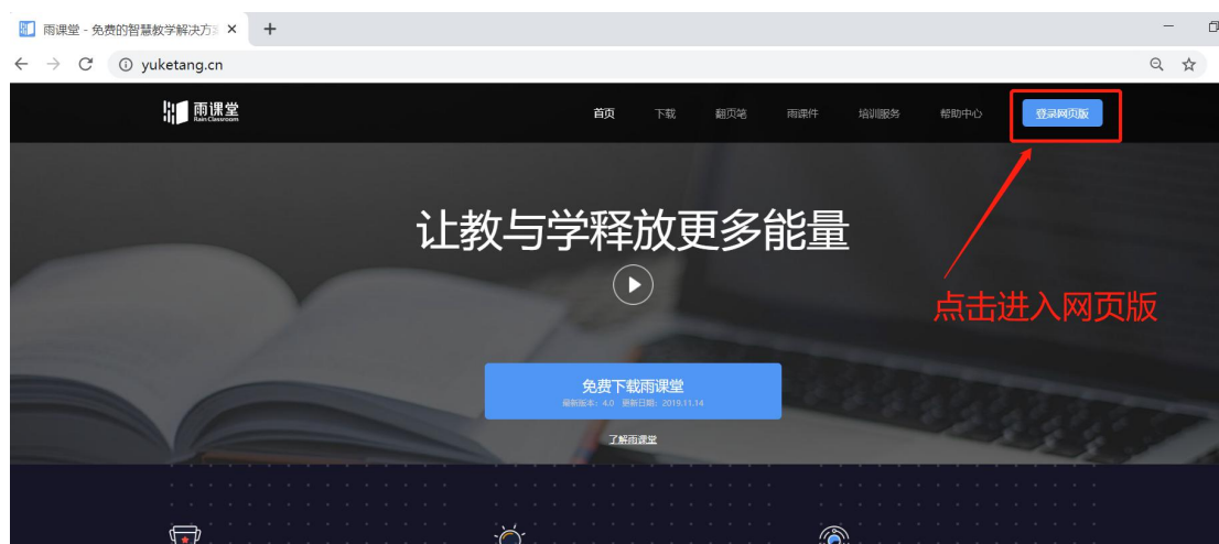
图7 雨课堂网页版登录界面

通过浏览器进入雨课堂网页版（ http://yuketang.cn ），点击右上角【登录网页版】，如图7所示。之后用绑定了账号的微信扫码进入课程观看页面。